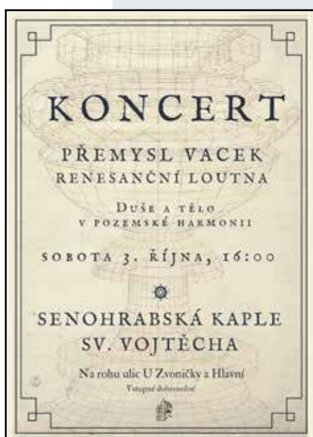
Dne 3. října jsme uspořádali koncert předního českého loutnisty a znalce autentické interpretace staré hudby Přemysla Vacka.