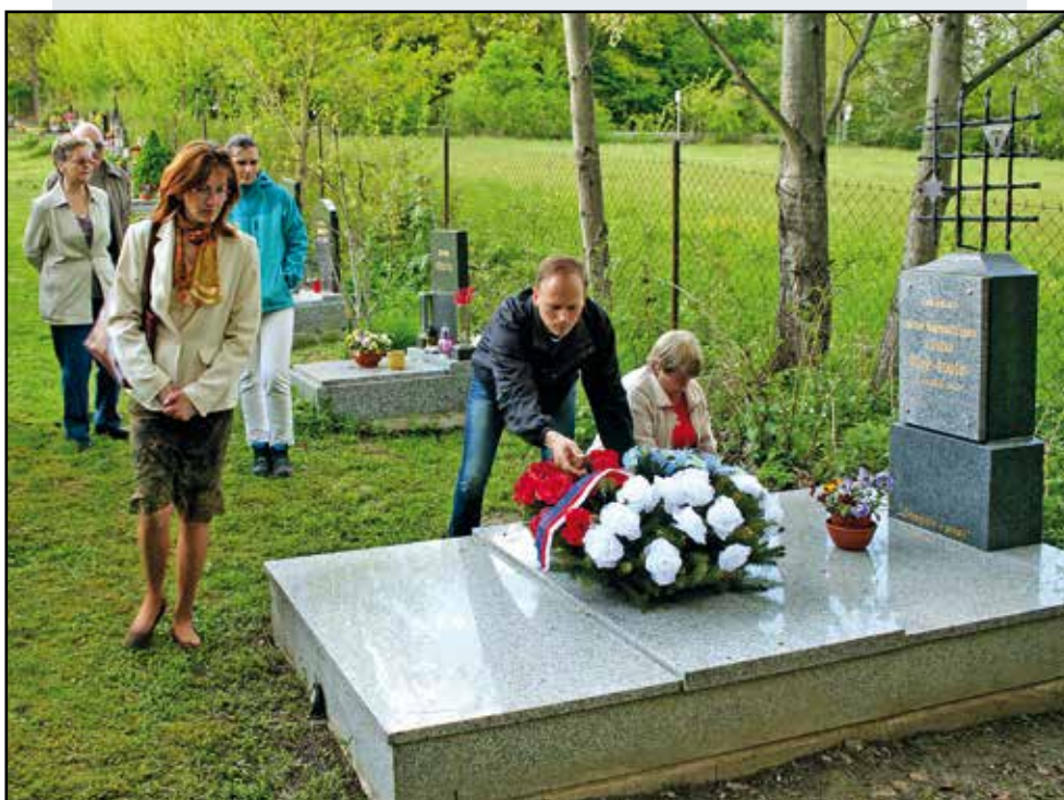
Vzpomínka na oběti nacismu, nad hrobem dvou neznámých zemřelých z transportu smrti na mirošovickém hřbitově