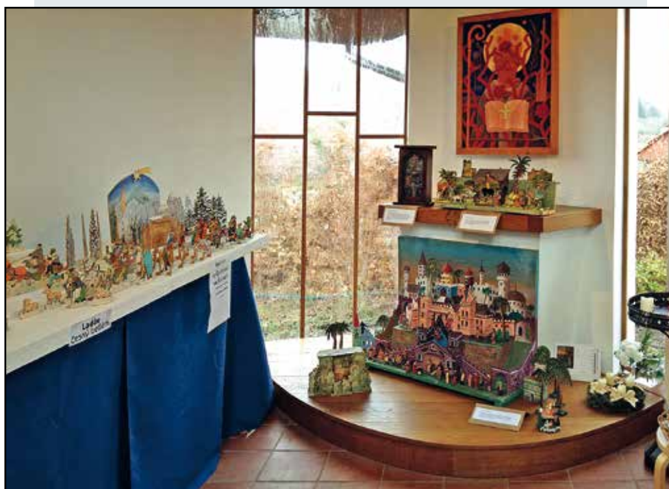
O víkendu před Vánocemi jsme v kapli uspořádali výstavu betlémů ze sbírek našich členů.