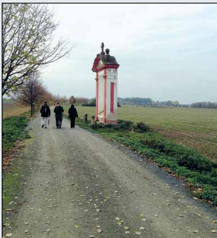
Pouť do kostela Navštívení Panny Marie Panně v Hájků u Prahy